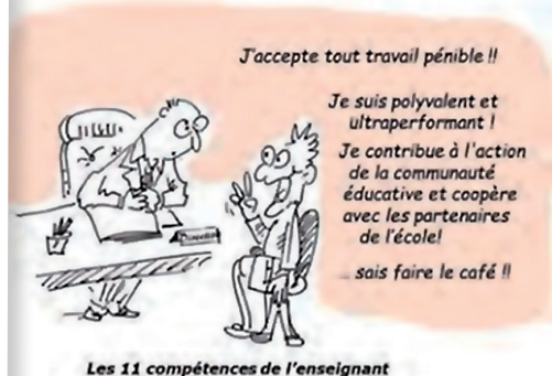
Les 11 compétences de l'enseignant

Séparer le confessionnel, qui relève de la sphère privée, du professionnel, est un élément de base de notre action syndicale